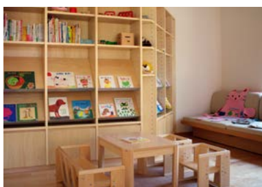
保育士の選んだ子育ての書籍、小さな子ども向けの絵本が利用できます。