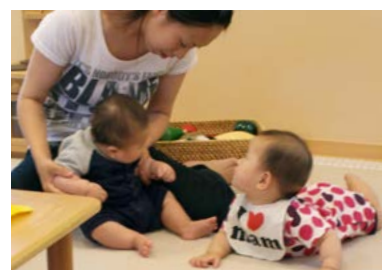
色々な発達段階で、個性豊かなお子さんの姿に接することができます。