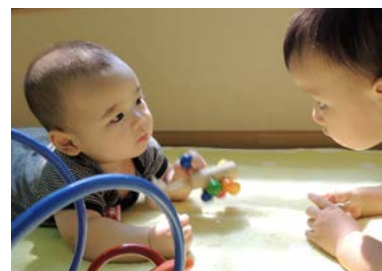
0歳ってどんな感じ？実際の様子を見たり触れたり…