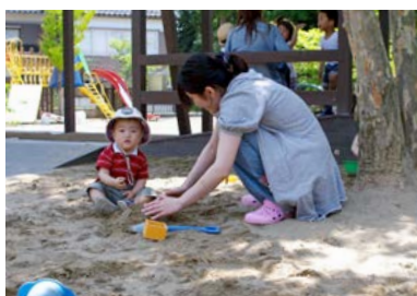
庭で遊ぶ子どもの様子を見たり、遊ぶ相手をしてみたり